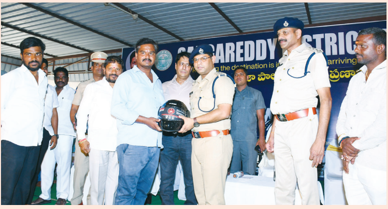
రోడ్డు ప్రమాదాలను తగ్గించి ప్రజల్లో రోడ్డు భద్రతపై అవగాహన పెంచే ఉద్దేశంతో వారం రోజుల పాటు 'అరైవ్ అలైవ్' కార్యక్రమాన్ని నిర్వహిస్తున్నామని తెలిపారు. రోడ్డు ప్రమాదాలను నివారించడానికి ట్రాఫిక్ నియమాలపై అవగాహన తప్పనిసరి అని అన్నారు. ప్రతి వాహనదారుడు ట్రాఫిక్ నిబంధనలు పాటిస్తూ హెల్మెట్, సీట్ బెల్ట్ తప్పనిసరిగా ధరించి, పరిమిత వేగంతో ప్రయాణించాలని సూచించారు.