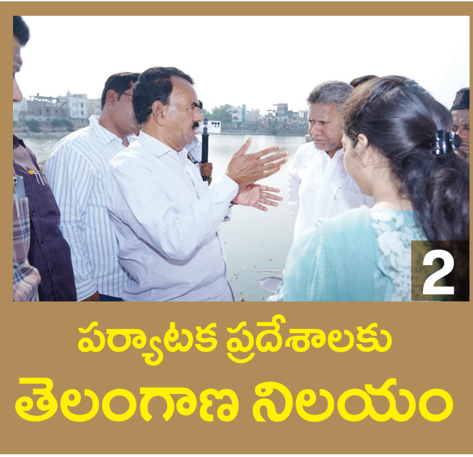
పర్యాటక ప్రదేశాలకు తెలంగాణ నిలయం