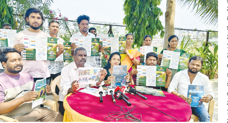
లక్షల రూపాయలు గడించారు. కోట్ల రూపాయలు సంపాదించాలన్న దురుద్దేశంతో తనను సమీప సభ్యులను మోసం చేసినందుకు కొత్త పథకాన్ని ప్రారంభించారు. 2025లో శుభక్షేత్ర ప్రాజెక్ట్ పేరుతో తన

పాటు ఇస్తానని నమ్మబలికారు. అంతేకాక కట్టినవారు మరొకరి చేత ఐదు లక్షల రూపాయలు కట్టిస్తే 5 వేల రూపాయల చొప్పున పనిపని చెల్లిస్తానని నమ్మబలికారు. తమతో కలిసి పనిచేసిన వ్యక్తి కావడంతో 32 మంది బాధితులు ఒక కోటి 60 లక్షల రూపాయలు పెట్టుబడిగా పెట్టారు. కొన్ని నెలలు ప్రతి నెలా కమిషన్ చెల్లిస్తూ తదనంతరం సొకులు చెబుతూ తప్పించుకుంటూ తిరగడం ప్రారంభించారు. అసమానం వచ్చి అంటికి వెళ్లి నిలదీసి ఏకంగా మరణం వచ్చింది. ఇదిలా ఉండగా పటాన్ చెరులో పాటు తెలంగాణ, ఆంధ్ర ప్రదేశ్ రాష్ట్రాలకు చెందిన సుమారు 130 మంది నుండి 7 కోట్ల రూపాయలు వరకు డిమాండ్లు సేకరించి తప్పించుకొని తిరుగుతున్నారని బాధితులు తెలిపారు. తమకు ఎలాగైనా న్యాయం చేయాలని బాధితులు కోరుతున్నారు. ఇదిలా ఉండగా ఈ కేసుకి సింగర్ మండ్లికి ఎటువంటి సంబంధం లేదని, అంశా హేమకాంత్ రెడ్డి నేతృత్వంలోనే మోసం జరిగిందని వారు తెలిపారు.