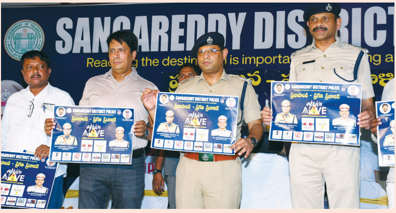
అతివేగం క్షణకాలం ఆసంద్యాన్ని కలిగించినప్పు టీకీ, ప్రాణ నష్టానికి దారితీసే ప్రమాదం ఉందని హెచ్చరించారు. రోడ్డు ప్రమాదంలో కుటుంబ యజ్ మానిని కోల్పోతే ఆ కుటుంబం ఎంతటి కష్టాల్లో